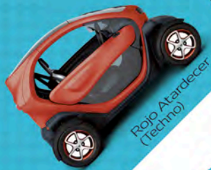
Rojo Atardecer (Techno)