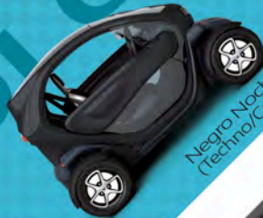
Negro Noche (Techno/Cargos)