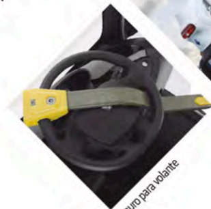
Seguro para volante