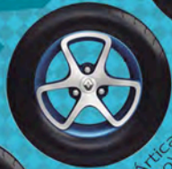
Rin Artica Azul (Techno)