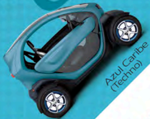
Azul Caribe (Techno)